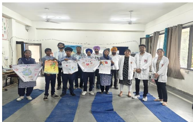
Govt.Smart Primary and High School