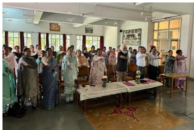
Dashmesh Girls College