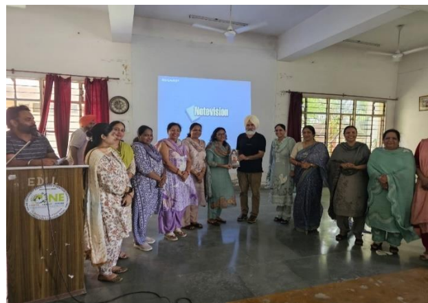
Dashmesh Girls College