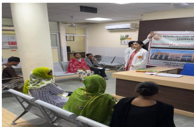
UPHC Lal Singh Nagar